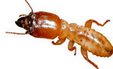
Termita Madera Seca