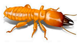
Termita Madera Húmeda

Las bases de la casa, los muebles, las repisas, los libros, las alfombras y los materiales aislantes, son todos fuentes de comida posibles para las termitas